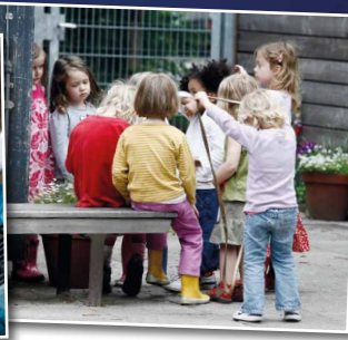
Kinder der Kita an der Fachschule für Sozialpädagogik (FSP 2 )